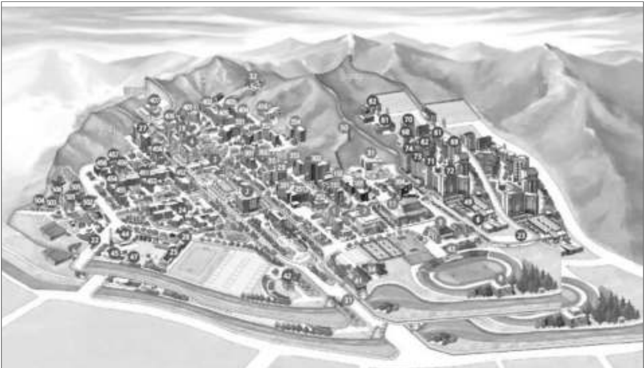
Gajwa Campus The hub for professional development in a premier industrial complex District A District B District C District D